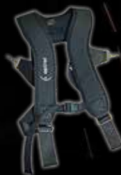
Harnais d'épaule (optional)