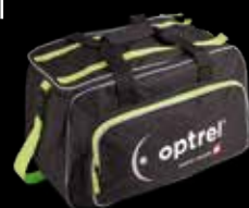
Sacoche de transport

Les systèmes de protection respiratoire optrel sont conçus sans compromis pour l'usage professionnel. Vous disposez ainsi de combinaisons casque/appareil de protection respiratoire taillées sur mesure qui peuvent être complétées avec différentes options de filtrage et accessoires en vue d'obtenir le système parfait pour vos applications de soudage et d'affûtage.