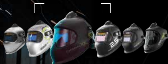
Casque à air frais

Les kits prêts à souder optrel contiennent :