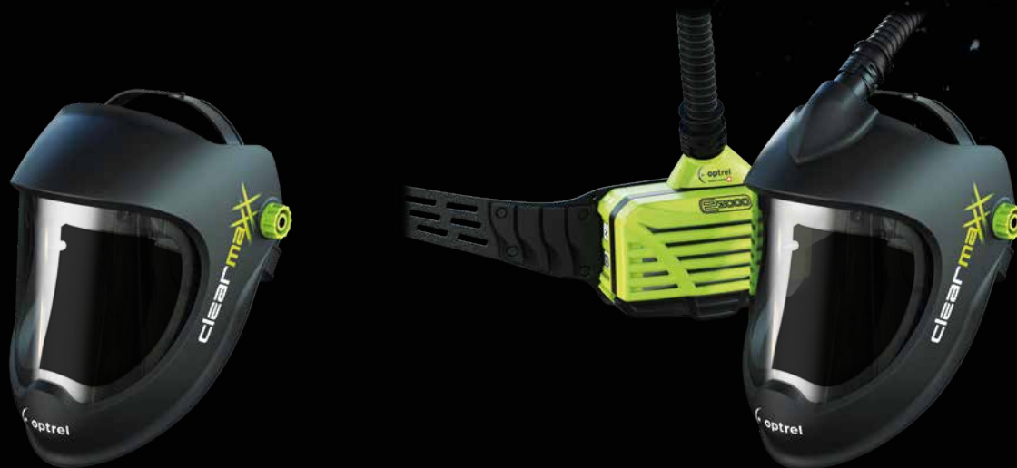
Art.-Nr. 1100.000 optrel clearmaxx version standard